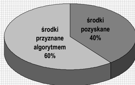
Struktura środków na aktywizację w 2016 r. (%)