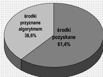
Struktura środków na aktywizację w 2015 r. (%)