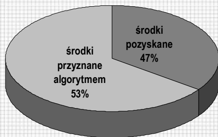
Struktura środków na aktywizację w 2018 r. (%)