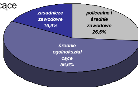
Struktura wykształcenia absolwentów jaworzniackich szkół ponadgimnazjalnych pozostający w ewidencji PUP w Jaworznie w końcu 2013r.

Absolwenci jaworzniackich szkół ponadgimnazjalnych stanowili 4,2% ogółu osób bezrobotnych pozostających w ewidencji końcem 2013r.